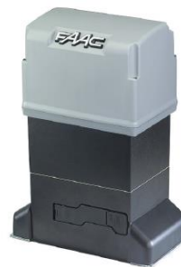
FAAC 844 ER motor med integrert styrekort type 780D

Porten leveres i lengder opp til 9 meter og høyder opp til 2,5 meter. Ved høyder over 2,5 meter og lengder over 9 meter bør man gå over til port type NOS PI200W som har en noe kraftigere konstruksjon og motor.