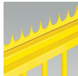
Ved behov kan porten leveres med taggjern -«Anti-climb spikes»